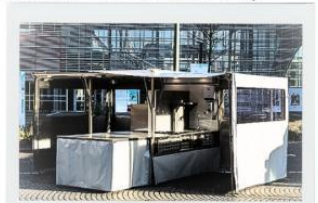
La cuisine mobile solidaire

Des visites cartographiques avec les habitant.e.s sont organisées afin d'identifier les lieux pouvant accueillir la cuisine mobile